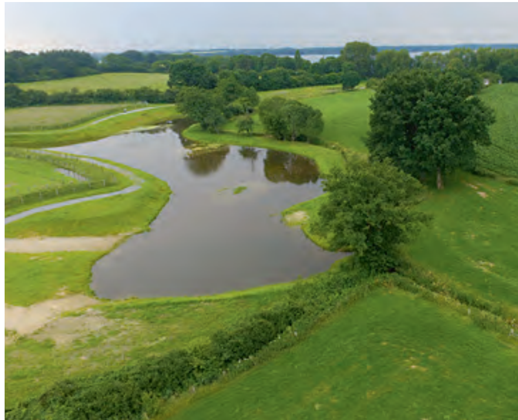
Das Retentionsbecken nach Fertigstellung, Juli 2017