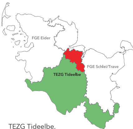
TEZG Tideelbe, BG 10 - Obere Eider