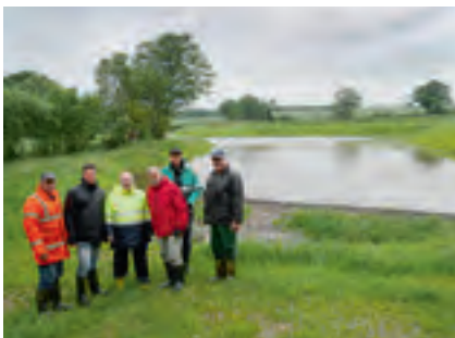
Viele Akteure arbeiten bei Planung und Bau zusammen

Mittelwerte (1.5.2017-15.6.2018) der Gesamt-Phosphor-Konzentrationen (mg/l) im Zu- und Ablauf des Retentionsbeckens und in der Mühlenbek vor der Mündung in den Wittensee