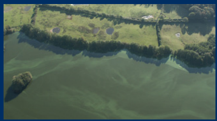
Algenentwicklung am Südostufer des Bistensees

Durch den übermäßig vorhandenen Phosphor können viele Mikroalgen (Phytoplankton) wachsen. Dadurch wird das Wasser trübe oder färbt sich grün. Die Sichttiefe wird geringer. Es kann nur noch wenig Licht eindringen und die Unterwasserpflanzen können sich nicht entwickeln.