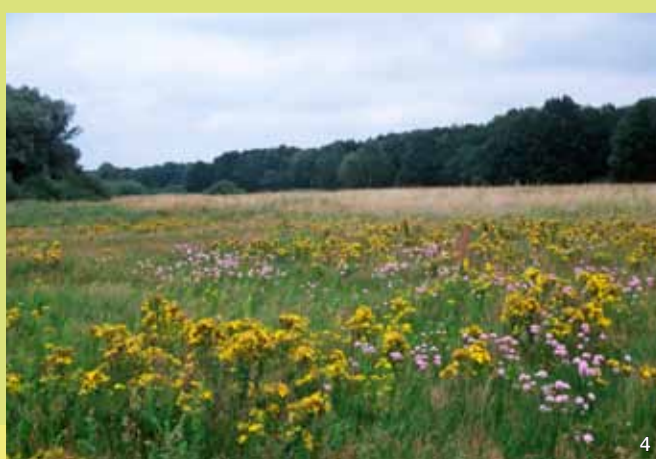
4 Sandtrockenrasen mit Grasnelke und Johanniskraut

Seit 1955, mit dem Bau der Geesthachter Schleuse, ist das Gebiet der natürlichen Dynamik eines Flusstales entzogen worden. Seitdem ist es nicht mehr dem direkten Hochwasser der Elbe ausgesetzt, so dass beispielsweise kaum noch offene Standorte auf natürliche Weise entstehen können.