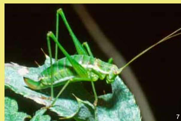
Weibchen der Gestreiften Zartschrecke

Die Gestreifte Zartschrecke hat hier das nordwestlichste derzeit bekannte Vorkommen Deutschlands. Sie ist auf warme, südexponierte Dünen und schütterere Pflanzenbestände mit Schafgarbe und Bibernelle angewiesen.