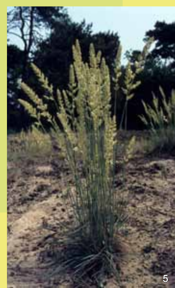
5 Düne mit dem Blaugrünen Schillergras

Um die Lebensräume der seltenen und gefährdeten Arten zu sichern, werden Pflegemaßnahmen durchgeführt, die eine vollständige Bewaldung der offenen Bereiche verhindern. Durch Beweidung oder Mahd und die Entwicklung naturnaher Wasserstandsverhältnisse sollen auch die Lebensgemeinschaften der Sandwiesen und Flutmulden erhalten werden.