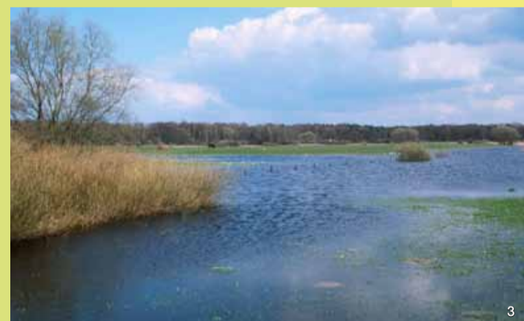
3 Elbsandwiese mit Qualmwasser bei Frühjahrshochwasser

Um die Lebensräume der seltenen und gefährdeten Arten zu sichern, werden Pflegemaßnahmen durchgeführt, die eine vollständige Bewaldung der offenen Bereiche verhindern. Durch Beweidung oder Mahd und die Entwicklung naturnaher Wasserstandsverhältnisse sollen auch die Lebensgemeinschaften der Sandwiesen und Flutmulden erhalten werden.