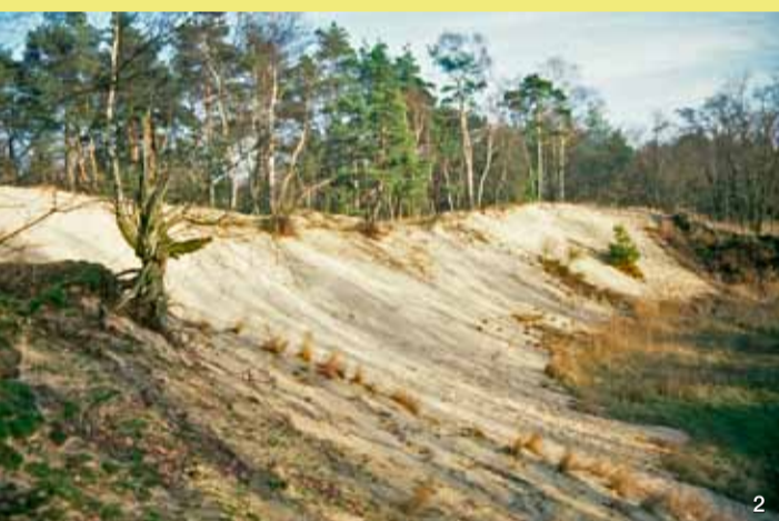
2 Große Düne im Kernbereich des Naturschutzgebietes

NATURA 2000 – Lebensräume erhalten und entwickeln