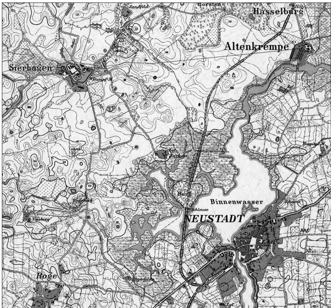
Abb. 1: Ausschnitt aus der Königlich-Preußischen Landesaufnahme von 1877

In Verbindung mit dem holozänen Meeresspiegelanstieg und der Landsenkung war das Niedermoor durch seine direkte Verbindung zur Ostsee den aperiodischen Wasserständen und dem damit verbundenem Salzwassereinstrom ausgesetzt. Das Gebiet versumpfte, die Wasserflächen vergrößerten sich allmählich. Über die Jahrhunderte hinweg wurden bei starkem Wellengang Teile des Niederungsmoores weggespült, so dass sich Warder und Halbinseln herausbildeten. Auf diese Weise entstand eine etwa 220 Hektar große Wasserfläche mit einer mittleren Tiefe von 1,3 m. Mit dem Überfluten setzte die natürliche Besiedlung mit einer spezialisierten Flora und Fauna ein. Auf den Moorresten und den versumpften Moränenböden entstanden Salzwiesen, die durch Überspülung einen ständigen nährstoffreichen Sedimentzuwachs verzeichnen (FÖRSTER 1989).