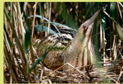
Rohrdommeln sind scheue, nachtaktive, etwa haushuhn große Reihervögel. Durch Federzeichnung und Körperhaltung sind sie gut getarnt und ihrem Lebensraum ausgezeichnet angepasst.