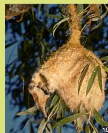
Beutelmeisen bauen aus Samenwolle, Spinnweben und Pflanzenfasern ein kunstvolles Nest nah am Wasser.