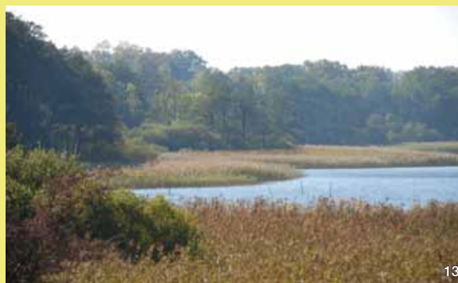
Die unzugänglichen, urwüchsigen, vielfältig strukturierten Ufer mit ihrer typischen Verlandungsvegetation sind Lebensraum seltener Tier- und Pflanzenarten. Am Nordostufer, im Naturschutzgebiet, ist dieser Lebensraum fast unverändert in seiner Natürlichkeit erhalten geblieben.