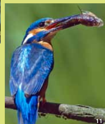
Eisvogel mit erbeutetem Kleinfisch. Weitere, typische Nahrung sind Insekten und Kleinkrebse. Eisvögel gehören neben Rohrdommeln und Kranichen zu den besonders seltenen Brutvögeln am Nordufer des Selenter Sees.