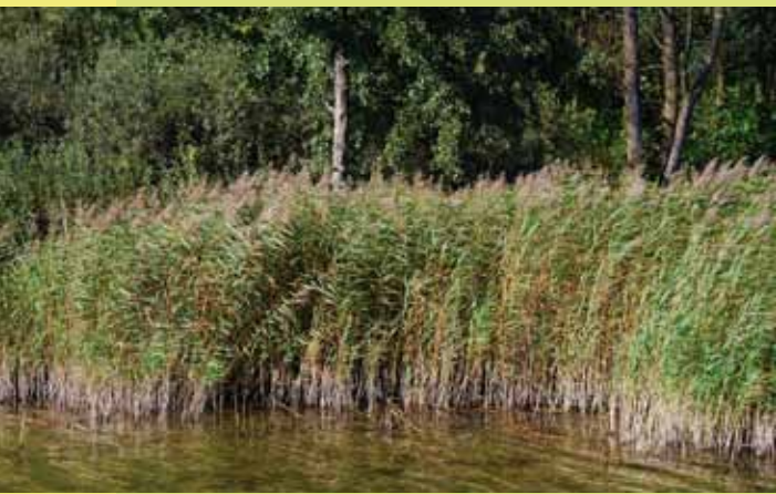
Den Ufer-Bruchwäldern sind abschnittsweise Schilf-Röhrichte vorgelagert.

Der Selenter See ist mit 2240 Hektar nach dem Großen Plöner See der zweitgrößte Binnensee in Schleswig-Holstein. Seit 1978 sind das stark gegliederte Nordostufer und daran angrenzende Teile der Wasserfläche auf einer Fläche von 705 Hektar unter Naturschutz gestellt. Urwüchsige Bruchwälder, breite Verlandungszonen und ausgedehnte, störungsarme Flachwasserbereiche bilden hier eine der größten zusammenhängenden und weitgehend natürlich erhaltenen Seeuferlandschaften Schleswig-Holsteins. Der Selenter See hat zudem internationale Bedeutung als Brut-, Mauser- und Überwinterungsgebiet für zahlreiche Wasservogelarten wie z.B. Schnatter- und Löffelente.