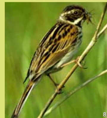
Rohrhammern oder, wegen den sperlingsähnlichen Rufen, „Rohrspatzen“ leben in der Uferzone des Sees. Sie ernähren sich hauptsächlich von Samen.