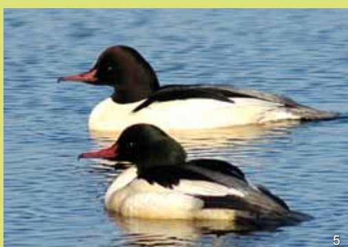
Gänsesäger sind auf Fischfang spezialisiert. Ihr im Bild gut erkennbarer Hakenschnabel ist zusätzlich seitlich sägeartig eingekerbt, so dass sie Fische besonders gut festhalten können.