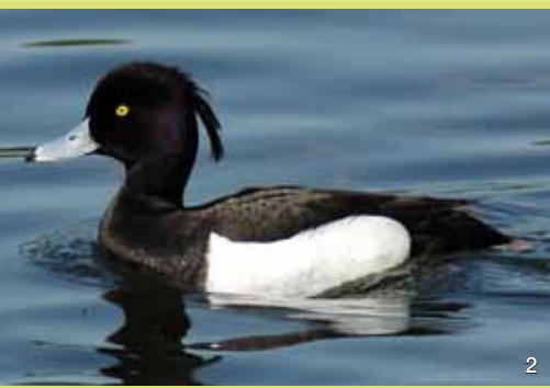
Schwarzer Schopf und schwarzweiße Färbung machen Reiherentenerpel im Prachtkleid unverwechselbar. Reiherenten tauchen nach Schnecken und Muscheln, verzehren aber auch andere Kleintiere und Pflanzen.

Redaktion, Grafik und Herstellung Planungsbüro Mordhorst-Bretschneider GmbH, Kolberger Straße 25, 24589 Nortorf Tel: 04392 / 69271, www.buero-mordhorst.de