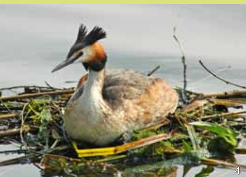
Haubentaucher bauen aus verschiedenen Pflanzenteilen schwimmende Nester, die meist in der Ufervegetation versteckt sind.