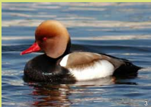
Kolbenenten, im Bild ein Männchen, ernähren sich hauptsächlich von Wasserpflanzen und Algen. Deshalb bevorzugen sie Seen mit reicher Unterwasservegetation.