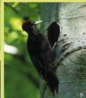
Schwarzspecht vor seiner Bruthöhle.