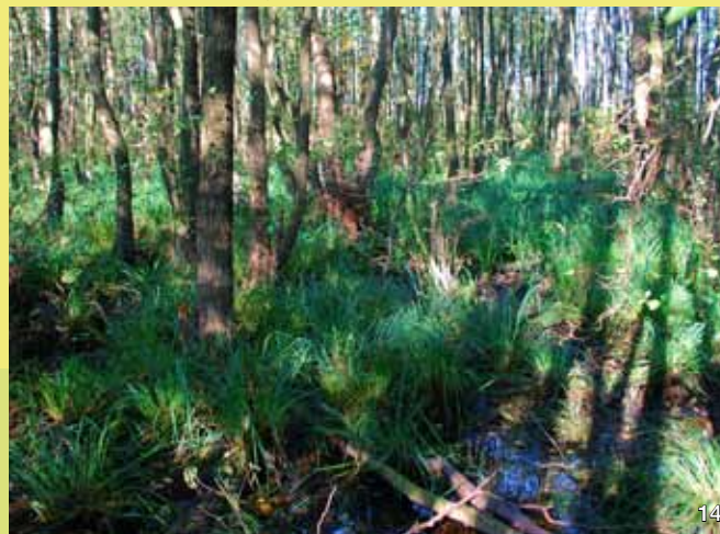
Bruchwald im Naturschutzgebiet