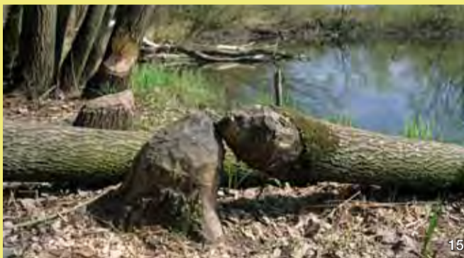
Seit 1996 ist der Biber von Osten her wieder in diesen Abschnitt der Elbe eingewandert und hat seitdem mit der „Neugestaltung“ seines Lebensraumes begonnen.

Durch eines der Täler führte im Mittelalter die „Alte Salzstraße“ zum Elbübergang (Furt). Dieser wurde damals von der Ertheneburg aus gesichert.