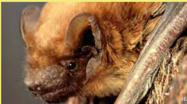
Der Elbhänge wird von wärmeliebenden Insekten besiedelt, die den zahlreichen Fledermäusen als Nahrung dienen. Der Große Abendsegler (16) und die Wasserfledermaus (17) jagen in der Dämmerung. Auch die Arbeit der Spechte ist für die Fledermäuse von Bedeutung. Sie nutzen verlassene Höhlen als Sommerquartiere und als Wochenstuben.