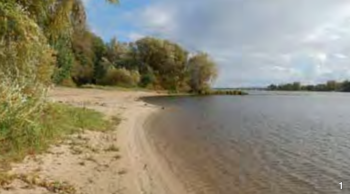
Das Elbufer ist Lebensraum sehr seltener Pflanzenarten.