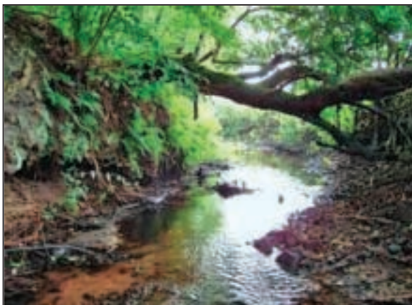
Blick bachabwärts in westliche Richtung

Erreichbarkeit des guten ökologischen Zustandes erscheint für den gesamten Wasserkörper mittelfristig bis 2015 bei zeitnaher Durchführung von Maßnahmen möglich