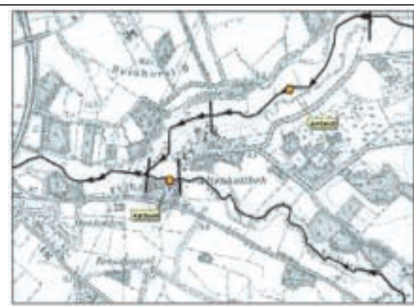
Lage der Probestrecken (alle Qualitätskomponenten)