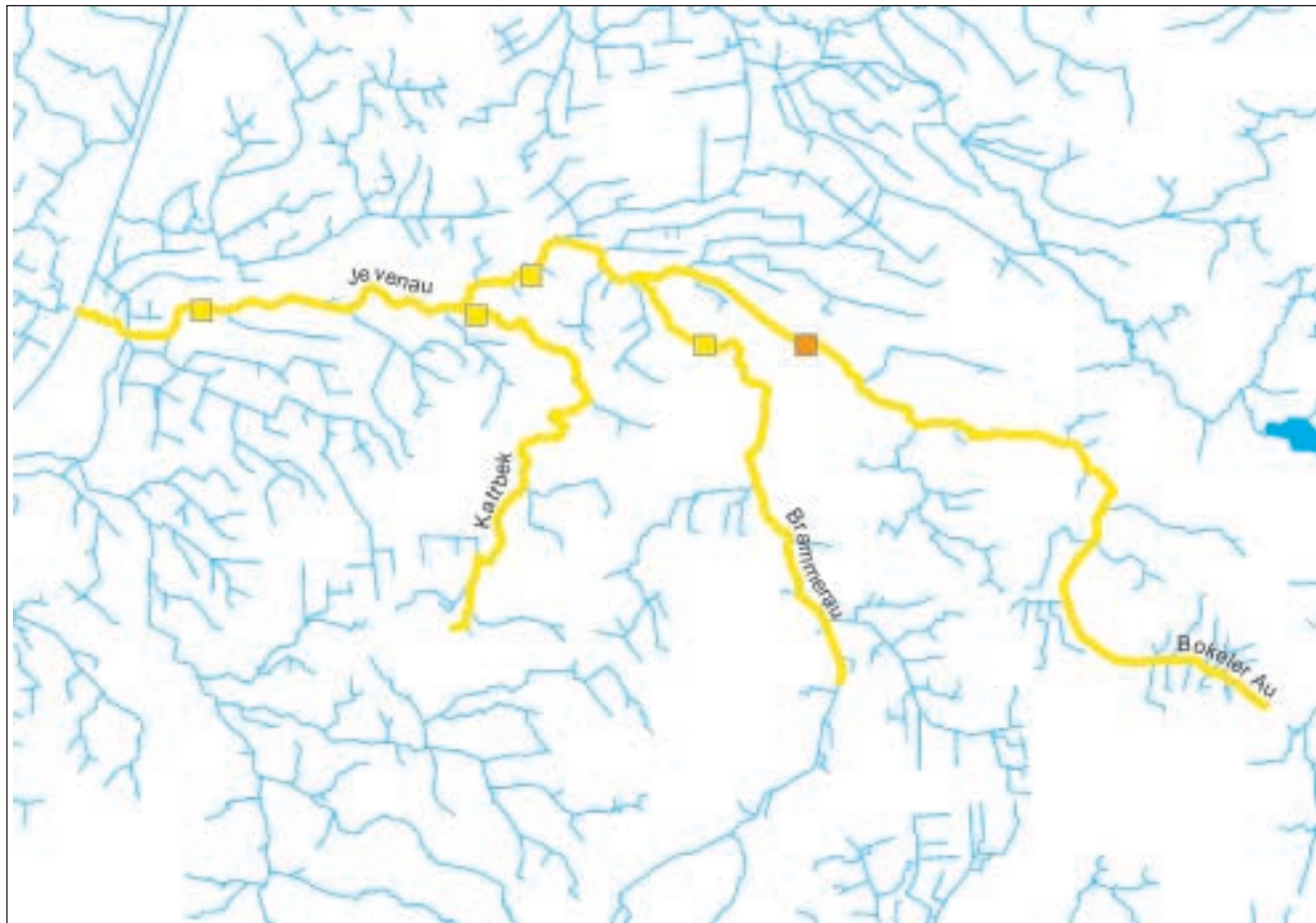
Abbildung 4: Lage und Bewertung der an der Jevenau untersuchten Stationen

weise eine organische Belastung vorliegt, denn die Gewässergüte wird hier nur mit mäßig bewertet. Insgesamt ergibt sich für den ökologischen Zustand des Wasserkörpers eine mäßige Bewertung (Abbildung 4). Eine Teilung des Wasserkörpers scheint nicht sinnvoll, da alle Gewässer eine vergleichbare Struktur und ähnliche Landnutzung aufweisen.